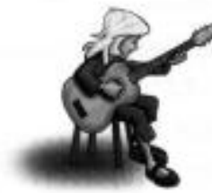
3 she / play the guitar