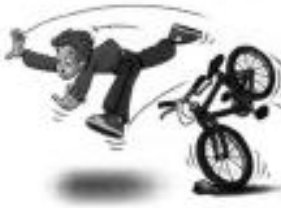
1 he / ride a bike